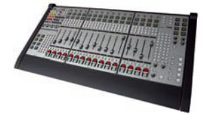
VADIS D.C.II [2000]

在业务扩展的背景下，KLOTZ DIGITAL 澳大利亚公司成立 奥林匹克运动会，悉尼 广东省广播电台，中国 XM卫星广播电台，美国