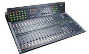
VADIS D.C. [1996]

第一套数字混合界面 安装的第一个分步式信号处理并由网络控制的广播平台 ASTRO MEASAT，吉隆坡，马来西亚