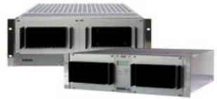
VADIS 888 & VADIS 212 [2006]

首先推出新一代领域的音频混合控制台。其次是在2005年和2007年进一步推出不同类型的控制台。