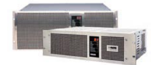
VADIS 880 & VADIS 210 [2000]

第一个完全自动化的音频控制系统 安装于卫星电视中心 在美国建立KLOTZ DIGITAL 音频系统有限公司