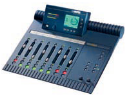
Award winning PARADIGM [1998]