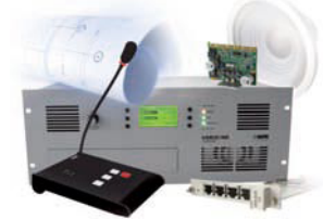
VARIZONE VAB-Line [2007]

第一套集成模拟技术于数字架构下的，混合型扩声和公共广播系统。 北莱茵-威斯特法伦州议会，德国